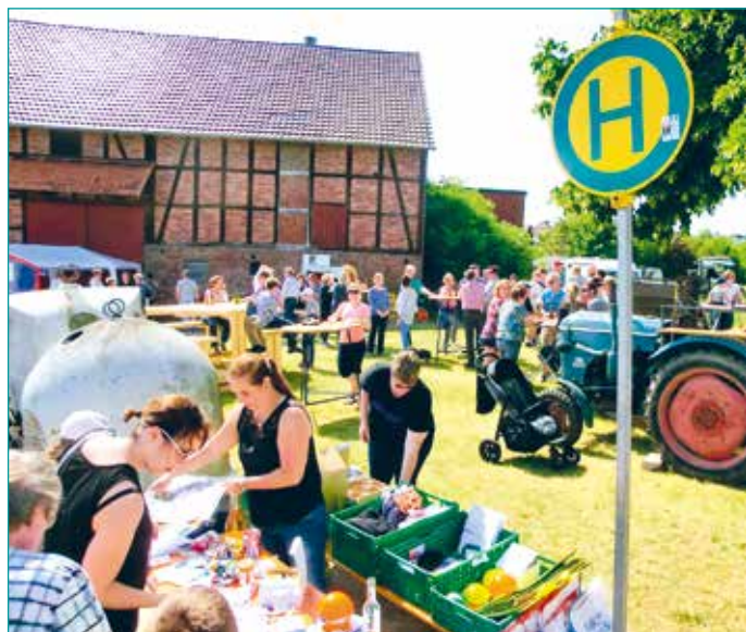
Immer gut besucht ist das Dreschplatzfest in Anzefahr