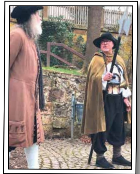
Ein eingespieltes Team

Ein besonderer Fokus lag auf der bedeutenden Lage Wetters an der sogenannten „Alten Weinstraße“, einer historischen Wagenstraße, die über Jahrhunderte hinweg eine wichtige Nord-Süd-Verbindung darstellte. Diese alte Heer- und Handelsstraße prägte die Entwicklung der Stadt maßgeblich und machte sie zu einem bedeutenden Knotenpunkt für Reisende, Händler und Fuhrleute. Entsprechend florierte auch das Gastgewerbe entlang dieser Route. Auch wirtschaftlich nahm Wetter im Mittelalter eine herausragende Stellung ein. Das nachweislich eigene Münzsystem der Stadt unterstreicht ihre damalige Bedeutung als regionales Handelszentrum.