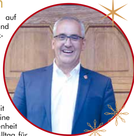
Olaf Hausmann Bürgermeister

Ich wünsche Ihnen allen ein stimmungsvolles Weihnachtsfest, einen guten Rutsch in das neue Jahr und freue mich auf ein Treffen beim Theaterstück, dem Berjes-Würfeln oder auch auf dem Neujahrsmarkt.